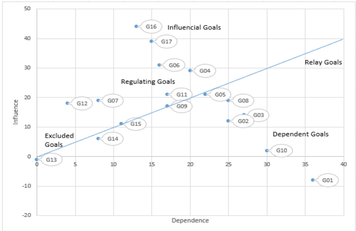
الشكل (4): علاقة الهدف (8) بأهداف التنمية الأخرى.

يتضح من الشكل (4) أن الهدف الثامن أهداف التنمية المستدامة يتأثر بالأهداف السادس عشر والسابع عشر، والسادس الرابع بشكل مباشر، بالمقابل يؤثر الهدف الثامن في الأهداف الأول، والعاشر، والثاني والثالث، والثامن والخامس والتاسع والحادي عشر. وفي هذا السياق فإن هذا التأثير يأخذ بالاعتبار التأثير للهدف ككل ولا يقتصر التأثير على مؤشر المتعلق بمساهمة السياحة في الناتج المحلي الإجمالي فقط.