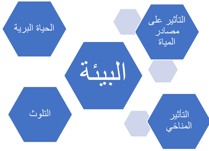
الشكل (2) : التأثيرات التي يمكن أن تنتج من ممارسة النشاطات السياحية